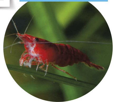
9 CREVETTES RED CHERRY (1)