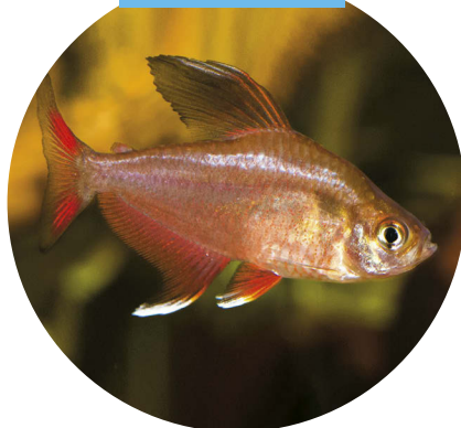
7 TÉTRA ROSE (1)